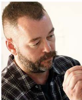
*Dick Page(ディック・ページ)

2013年春の新商品は、ブランドの象徴アイテムであるパーフェクトルージュを、新技術を採用して刷新します。また、数量限定発売し好評だったフェースカラー(2010年)、アイシャドー(2011年)を定番品として発売します。これらの商品を通じて、大人の女性ならではの意志の強さとしなやかさを感じさせるトータルメーキャップを提案します。