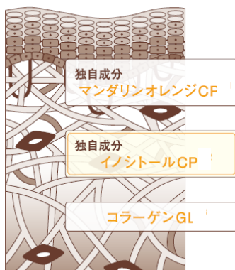
肌断面イメージ図

肌に触れた瞬間から すみずみまでうるおいで満たし、 湧き上がるようなハリと透明感あふれる肌へ導く【薬用】乳液