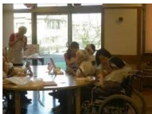
特別養護老人ホーム