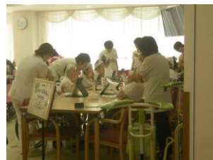
回復期リハビリテーション病院