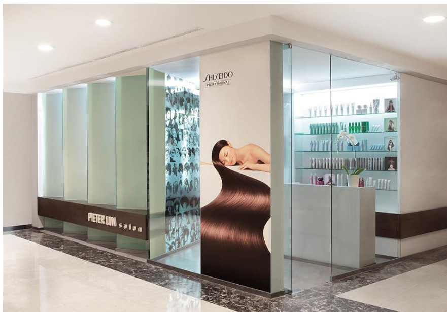
メダンのヘアサロン「ピーターリム」(入口)