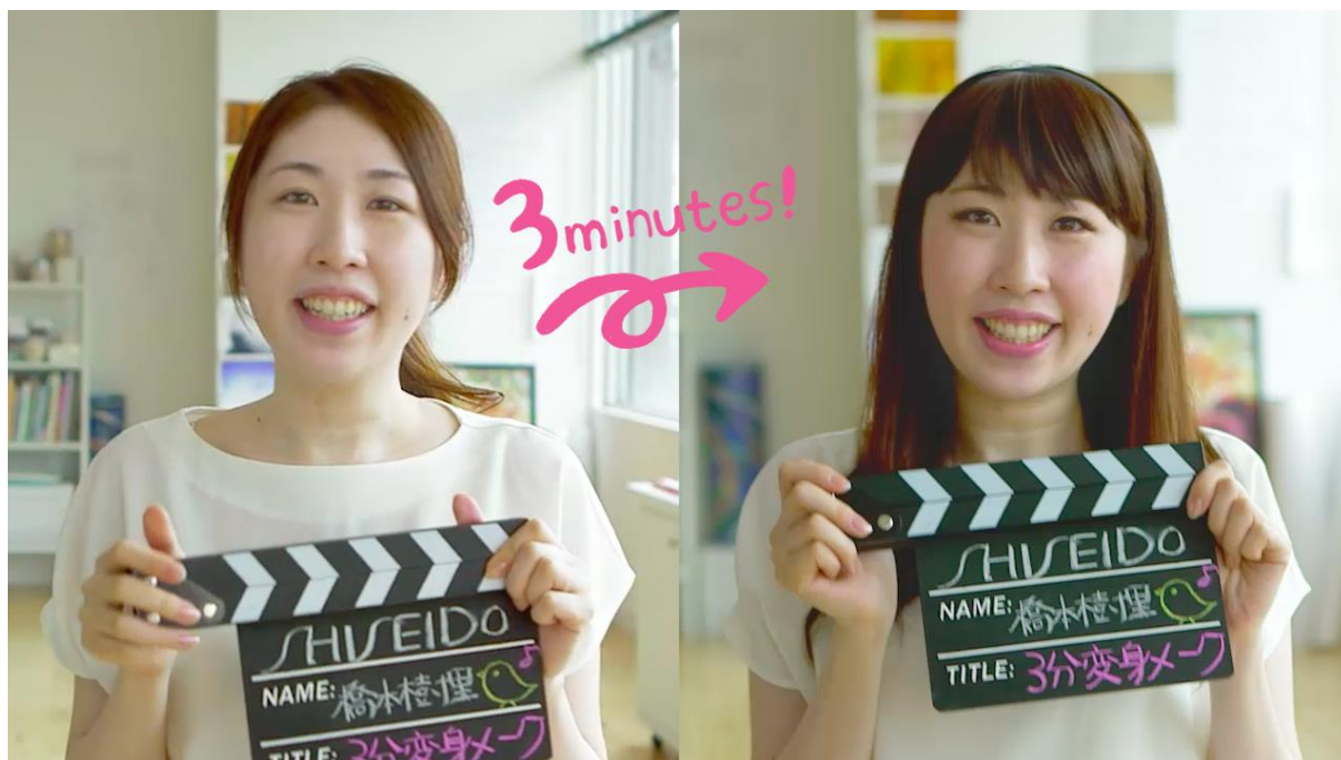
『秘密兵器で別人！3分変身メイク』

3名の個性が存分に発揮された、この「資生堂社員がやってみた。」シリーズ(出演BC3名、動画数:全4本)は、上品でナチュラルに一重を1.5倍に見せる方法などの実際に役に立つテクニックはもちろん、秘密兵器で別人になる3分変身メイクなど、華麗な手さばきで見応え抜群の裏技がたくさん詰まっています。