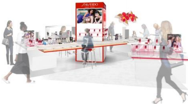
「SHISEIDO」ソーシャルカウンター

ブランドの新しいストーリーと新しい未来づくりの一環として、ロゴの中にブランドのこころである「GINZA」と「TOKYO」を加えました。