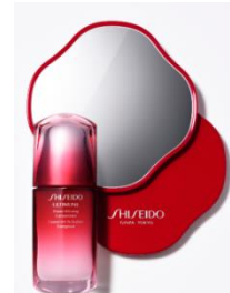
「資生堂 アルティミューン パワライジング コンセントレート キット」