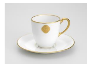
「花椿マーク」入りの食器