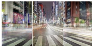
③ 勝又公仁彦氏 写真作品