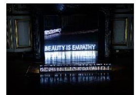
④ ロバート・モンゴメリー氏 作品