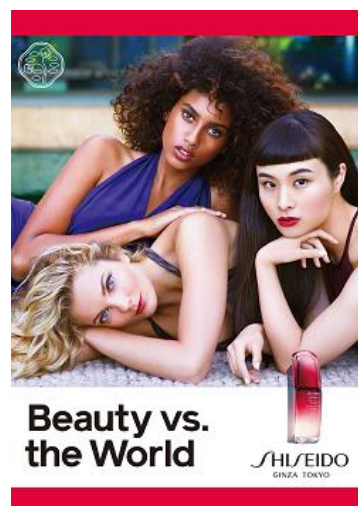
新「SHISEIDO」 アルティミューンの広告ビジュアル