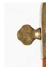
資生堂製鏡台留具(百花椿図より)