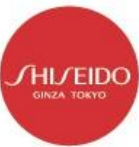
オリジナルマグネット