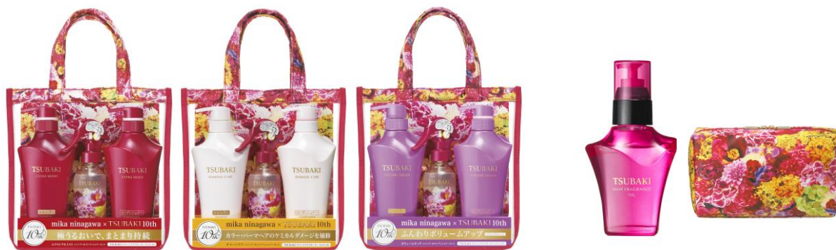
10周年スペシャルセット (シャンプー・ヘアコンディショナー・ダメージケアウォーター)

2006年、「日本女性の美を称賛し、応援する」をコンセプトに誕生した「TSUBAKI」は、女性たちの美しい髪の毛の魅力を最大限に引き出す美髪ケアを提案してきました。2015年には「髪と地肌をWケアする」商品へと機能を強化。そして2016年にはブランド誕生10周年を迎え、「これからも自分らしく美しく咲き続けていたい、という女性たちの気持ちに寄り添い、応援し続ける」というブランドの想いに共感いただいた蜷川実花さんと、スペシャルコラボレーションを展開します。