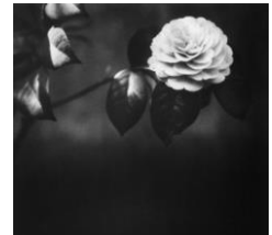
福原路草 椿 自邸庭 麻布筈町 1940