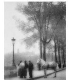
福原信三 博勞 『巴里とセイヌ』より 1913