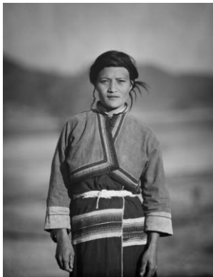
福原信三 不詳 台湾 1940