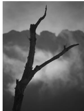
福原路草 以下不詳