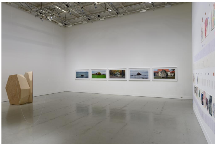
「椿会展 2016-初心-」会場風景