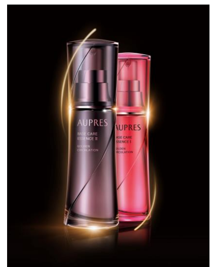
2017年3月発売 「ベースケアエッセンス」

ファンデーションやポイントメーキャップ類が含まれます。2017年11月よりリニューアルする予定です。