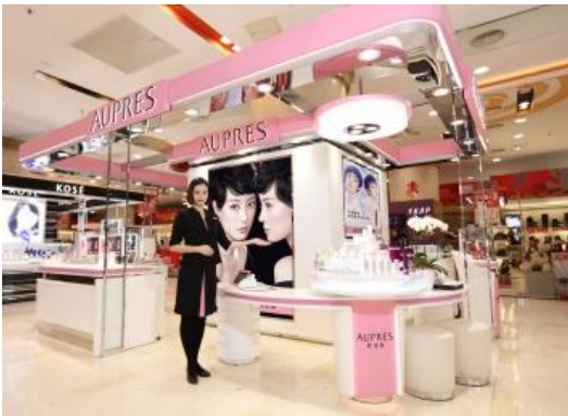
新カウンター（北京新世界デパート）