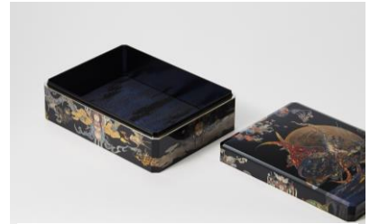
内側に西陣織の布を施す