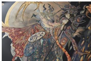
篠原資明博士の和歌から、 天野喜孝氏が原画を創作。 象彦が蒔絵を手掛ける