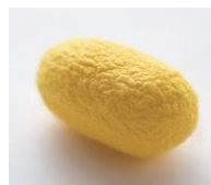
※ 5 プラチナムGS

ブレインスキン理論に着目した独自成分。「クレ・ド・ポー ボーテ」スキンケアのため、最高峰の養蚕技術によりつくられた希少なプラチナムゴールドの繭(プラチナムGS)※ 5 から直接抽出された「プラチナムゴールデンシルク(美容成分)」や、日本産真珠に由来する成分を中心とする独自の複合成分です。