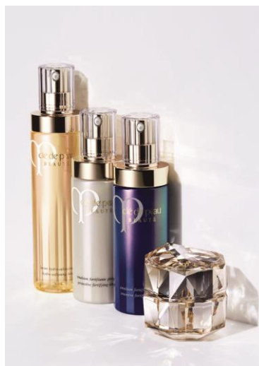
(写真)(左から) ローションイドロ A エマルションプロテクトゥリス エマルションアンタンシヴ ラ・クリームn (すべて、医薬部外品)

※ 1 インテージ SLI 一般化粧(ヘア除く)10,000 円以上 2014 年 1 月～12 月 金額シェア